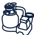
Groupe de filtration YZAKI 5,7m 3 /h